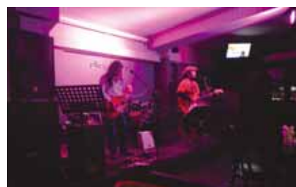
ローカル&洋食スタイルのフードはMSG不使用というこだわりで、やはりリーズナブル。イチオシはわさびしょうゆでいたく Sliced Beef(左下)とCrispy Pork Ribs(左上)。ボリューム満点のランチセットはRM12.90++! オリジナルカクテルも豊富。山形の銘酒「上喜元」、日本ブランドのウイスキー「白州」「響」などがリーズナブルな価格で楽しめるポイント。