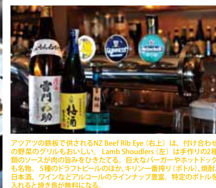
アツアツの鉄板で供されるNZ Beef Rib Eye(右上)は、付け合わせの野菜のグリルもおいしい。Lamb Shoulders(左)は手作りの2種類のソースが肉の旨みをひきたてる。巨大なバーガーやホットドッグも名物。5種のドラフトビールのほか、キリン一番搾り(ボトル)、焼酎、日本酒、ワインなどアルコールのラインナップ豊富。特定のボトルを入れると焼き鳥が無料になる。