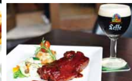
つまみに合わせてビールも選ぼう。柑橘系の爽やかなソースが特徴の Salmon Alamarie(右上)には、マレーシアではここだけしか味わえないラズベリー果汁とともに醸した爽やかな甘さのビール Hoegaarden Rosée が合う! ボリュームたっぷりなつまみが好みなら、Pork Ribs(右下)。こってりめのつまみには、赤ワインのような濃厚な味わいのビール Leffe Bruneを。