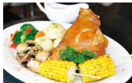
豚肉料理がオススメ。ホークケバ、客家ホークなどさまざまあるが、1日8個限定のホークナックル(右)は外側がカリカリで中はジューシー。7種のソーセージ盛り合わせ(左)はヨーロッパなどからの輸入品を使い品質は確か。付け合わせのマッシュポテトやサラダ、ソースもおいしく、ていねいに作られていることが分かる。夜9時以降は生バンドの演奏も楽しめる。