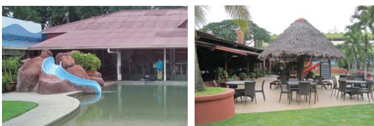
雑誌「タイムアウトKL」で「ベストスイミングプール」と称されたプール！ パーティーなどで貸し切れることもできます。

PJ Palms Sports Centre ● No.1, Lorong Sultan, 46200 PJ ◎ 8am-10pm 年中無休 ☎ 03-7960 7919 / 016-353 3555 ✉ pjpalms@gmail.com 🌐 http://www.pjpalms.com/