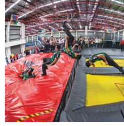
1時間RM20～。毎時0分に入場するシステムで、ウェブサイトから日時を選んで予約ができます。安全のため、滑り止め付きソックス(RM5)の着用必須。

初めの1時間の利用料 20%OFF セニョ〜ム 読者特典 ※土日は使用不可。2015年8月31日まで有効。チケットカウンターにて当日購入した場合のみ有効。ソックス料金は含まれません。他の特典との併用不可。Valid weekdays only, except Public holiday. Valid until 31st August. Walk in only. Excluding socks. Cannot be combined with other discounts.