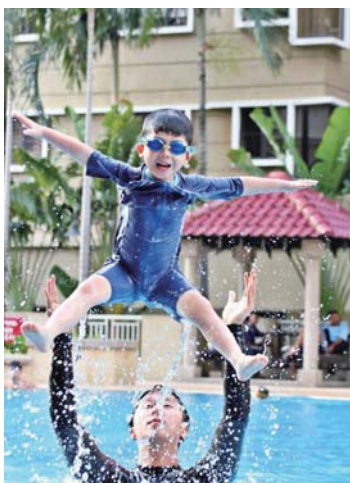
「無駄なエネルギーを使わずに泳ぐ方法」は一度習得すると、一生使える貴重なスキルとなります。こどもはもちろん、水泳が苦手な大人の方にもおすすめです。

「速く泳ぐ」のではなく「泳げるようになる」ための水泳教室。おぼれた経験などから水が怖い……という人でも、12時間のトレーニングを受ければ、恐怖心を克服し、ゆっくり泳げるようになるまでに専門家が指導してくれます。週末も営業しているから都合がいい時間に通えるし、最大4人の少人数制クラスできめ細やかな指導は定評あり。女性のインストラクターを含めて10人のプロがいて、体には触れずに指導してくれるので女の子や女性でも安心。また、以下のような特別コースもあります。 【ウォーターサバイバル】波の高い海は、プールとはまったく異なる環境です。口や鼻へ海水が入ってくるのを防いだり、いかに体を浮かせるかなど、いざというときに役に立つサバイバルスキルを学べます。 【セラピー&リラクゼーション】自閉症や脳性小児まひといった障がいがある方へのサポートにも実績あり。水に浮かぶことには癒しやポジティブになれる効果があります。