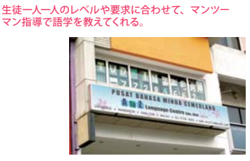
生徒一人一人のレベルや要求に合わせて、マンツーマン指導で語学を教えてください。

70B & 70C, Jalan SS21/62, Damansara Utama, 47400 PJ 03-7728 4662 10am-9:30pm、土：10am-6:30pm 日祝定休 www.atozlanguage.com