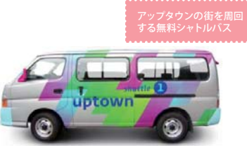
アップタウンの街を周回する無料シャトルバス