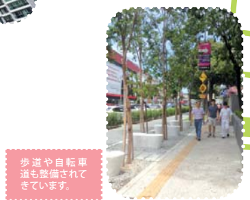
歩道や自転車道も整備されています。