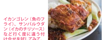
イカンゴレン(魚のフライ)、サンバルウダ(イカのチリソース)など行く度に違う付け合せを試してみ。