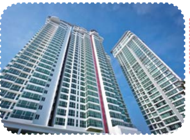
高級コンドミニアム「アップタウン・レジデンス」。既に建設が終わり、入居者が続々と増えている。敷地内にある「ハーブガーデン」は見ものです！