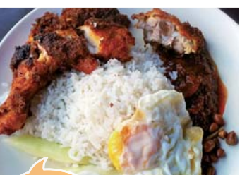
一度食べたら、病みつきに！

中国系スリムの夫婦が営むナシレマアヤムゴレンの超人気店。ナジブ首相やマハティール元首相も来店したナシレマの人気店。マレーシア人なら誰もが好きなナシレマですが、ここのはココナッツやショウガといったに炊いたご飯が風味豊かで、サンバル、イカンピリス、キュウリ、ゆで卵のベーシックな具材だけでも十分おいしい！追加するならルンダン・アヤム(チキンのハーブ煮込み)、アヤムゴレン(フライドチキン)がおすすめ！