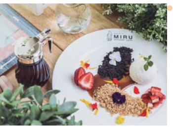
分厚いトーストに甘いイチミツやクリームがからまって、甘くて幸せ。

渋谷で人気の「ハニート」のカフェ。去年2015年の10月にオープンしたばかりのかわいらしい雰囲気のカフェ。人気はハニートースト。9種あり、おすすめは濃厚なCHEDDARチーズ、マレーシアスタイルのパンダンココナッツ。チョコ好きの方には、内側からチョコレートがとろけ出るラバケーキがおすすめ。ヘルシースイーツとして注目されつつあるフローズンヨーグルトとフルーツを混ぜたFroyo Shakeもありますよ！