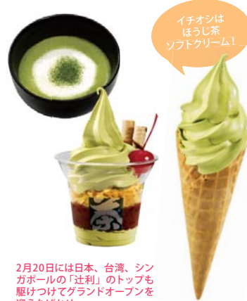
2月20日には日本、台湾、シンガポールの「辻利」のトッピングも駆けてグラントオープンを迎えたばかり。

150年の歴史を誇る京都祇園のお茶の老舗が初上陸。1860年、幕末の動乱のさなかに創業した辻利右衛門が創業し、宇治の茶業を再興させたお茶の老舗「辻利」のカフェが、台湾、中国、シンガポールに続き、マレーシアに上陸！抹茶や芳ばしいほうじ茶のドリンクのほか、お茶をふんだんに使ったスイーツやアイスクリーム、パフェやカキ氷などお茶好きにはたまらない充実のラインアップ♪モノトーンとグリーンの内装は落ち着く雰囲気。