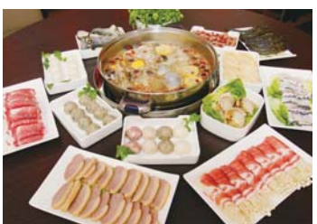
セットなら2人分でRM48++。写真は、豚肉や魚、アワビなども入った豪華なセット(2人分でRM88++)。

ローカル鍋で乾杯しよう！日本人にも人気の豚骨スープ鍋。スチームボートレストランで10年のキャリアをもつシェフのレシピによる白濁した香港風豚骨スープの鍋が人気。スープは9種類から選べるのですが、そのほとんどのベースが豚骨スープです。手作りの具材は、キノコ入りの豚肉ボールやトビコ入りのイカボール、猪肉やつまみにもよさそうなスモークソーセージなどかなりユニーク！手作りのソース3種を混ぜてつけて食べたら旨い！