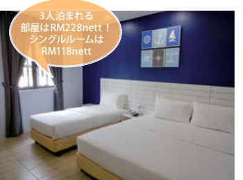
3人泊まれる部屋はRM228nett! シングルルームはRM118nett

心地いいソイコスパホテル。去年11月にオープン。海をイメージした落ち着いた雰囲気の青を基調とした内装の25部屋を備えています。部屋は4タイプ(キングサイズベッド1台+シングルベッド1台/クイーンサイズベッド1台/ダブルシングルベッド1台/シングルベッド1台)あり、すべてWi-Fi、エアコン、LEDテレビ(衛生放送あり)、ボトル入り飲料水、ドライヤー、アイロン、カード式のキーを装備。周囲にはおいしいレストランがいっぱい！