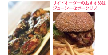
サイドオーダーのおすすめはジューシーなポークリブ。