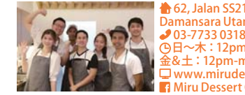
甘いドリンクのほか、コーヒーや紅茶の種類も豊富。

62, Jalan SS21/58, Damansara Utama, 47400 PJ 03-7733 0318 日～水：12pm-11pm 金&土：12pm-midnight 水曜定休 www.mirudessertcafe.com Miru Dessert Cafe