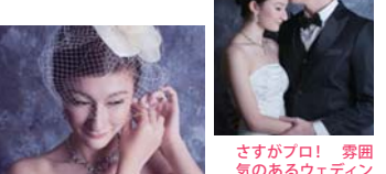
さすがプロ！雰囲気のあるウェディングフォトの撮影もしてくれます。

No.102M, Jalan SS21/39, Damansara Utama, 47400 PJ 11am-7pm、日：11am-5pm ※月曜定休 電話にて要予約 012-617 5731 | bowsandvows | www.bowsandvows.my