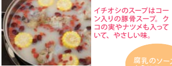
イチオシのスープは、コロン入りの豚骨スープ。クコの実やナツメも入っていて、やさしい味。