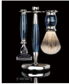
経営するのは高級ジュエリーのブランドを傘下にもつ「Bakhache Luxuries」。この高級感は本物!