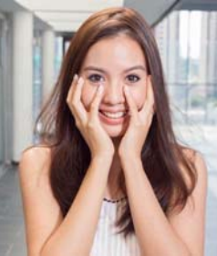
AKIさんの技術はもちろん、会話を楽しくもやってくるファンも! 一人ひとりに合ったナチュラルなスタイリングを提案してくれます。