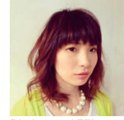
動きのあるエアリーな雰囲気!