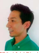
男性カットも大人気! 土日はメンズカットで予約が埋まってしまうこともあるほど!

【ヘア】 カット .....RM120/こどもRM60 カラー .....RM150 ~ パーマ .....RM230 ~ トリートメント .....RM120 ~ ヘアセット .....RM120 ~ 【ネイル】 ハンドジェル .....RM120 ~ フットジェル .....RM150 ~ ※1ヵ月以内のジェルネイル付け替えはオフ無料! ※ヘアと同時施術で10% OFF 【まつ毛エクステ】 フル .....RM270 タッチアップ .....RM160