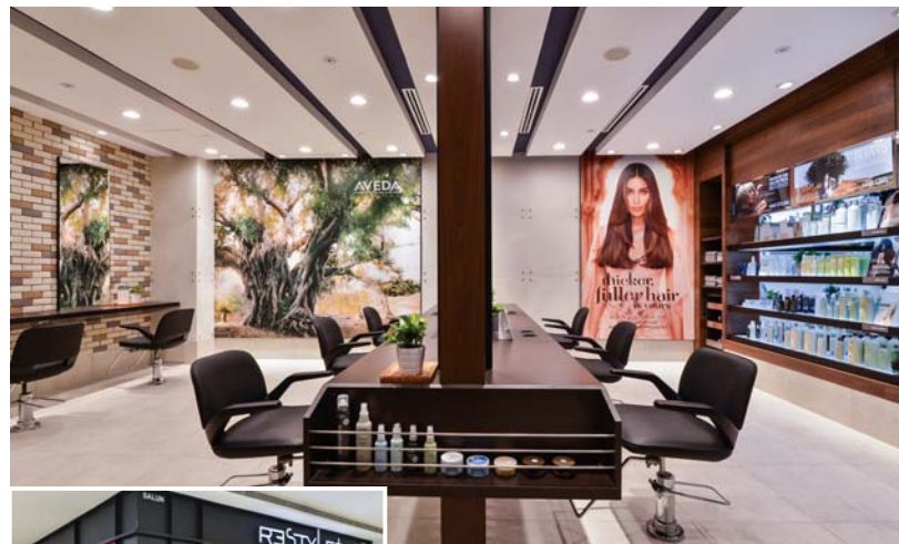
アヴェダ製品の全ラインナップが揃っている。

【Bangsar Shopping Centre】 S128 2nd Floor, Bangsar Shopping Centre, 285 Jalan Maarof, 59000 KL ☎03-2094 9555 【Bangsar Village II】 ☎03-2283 2233 【Mid Valley Megamall】 ☎03-2938 3131 【Sunnyway Pyramid】 ☎03-5635 2222 【Parkson Pavilion】 ☎03-2141 3232