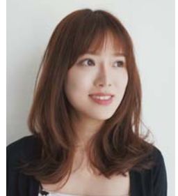
ナチュラルな仕上がりが好き。セットは簡単、毎朝ラクラク!