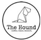
臭いもなく、一見おしゃべりなカフェそのもの。手作りのケーキもおいしい！

44-A, Jalan Hujan Emas 4, Taman Overseas Union Garden, KL 火水日: 12noon-10pm、木: 12noon-6pm、金土: 12pm-11pm 月曜定休 03-7971 2144 thehoundcafe