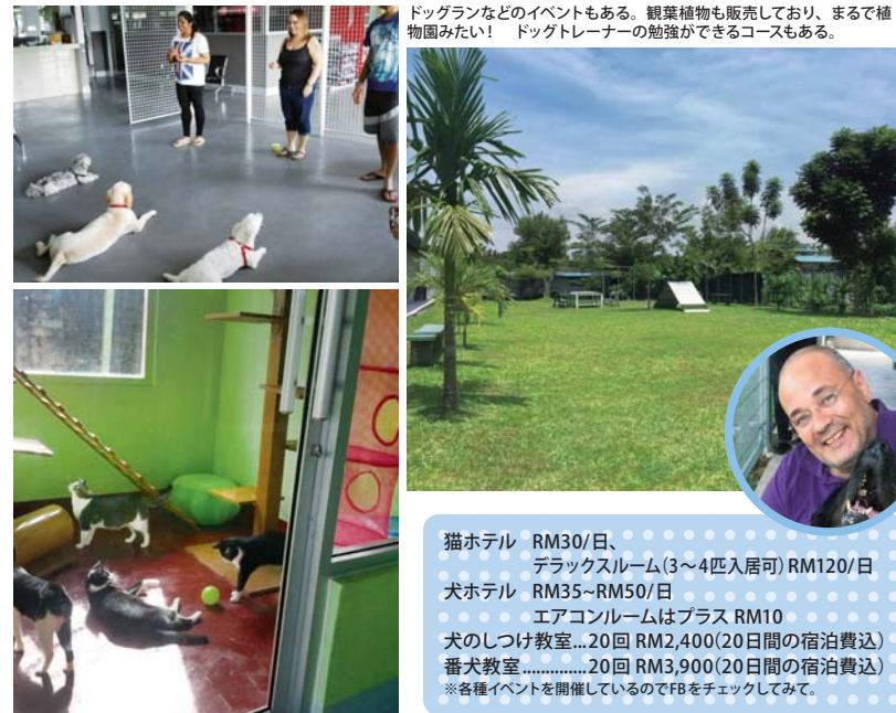
ドッグランなどのイベントもある。観葉植物も販売しており、まるで植物園みたい！ ドッグトレーナーの勉強ができるコースもある。