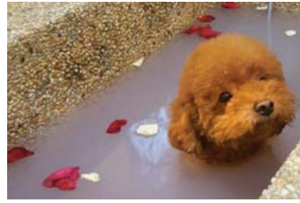
スパメニューはお得なパッケージも用意！

皮膚が弱かったり、毛並みの悪いわんちゃんに試して欲しい人気のペットスパ。鍼灸やグルーミングの他、ペットホテルやデイケアサービスも！ ペットホテルは常に清潔を保ち、駆け回れる空間も用意、CCTV設置で24時間スマホから愛犬の様子が見られます。なによりスタッフが心優しいので安心して任せられます。