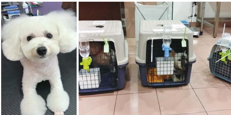
動物好きのオーナーによる、かゆいところに手が届くような愛情あふれるサービスがうれしい。

No.38, Lorong Rahim Kajai 14, Taman Tun Dr. Ismail, 60000 KL 11am-7pm 火曜定休 03-7728 7299 www.puppcottage.com.my puppcottage